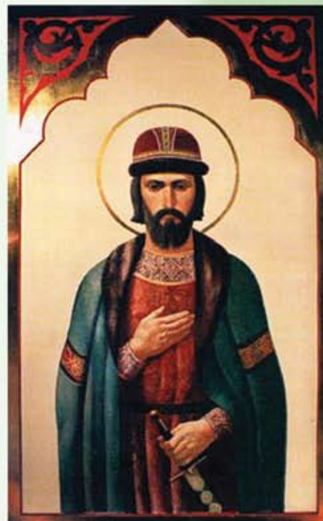
Святой мученик Меркурий Смоленский (память 7 декабря)

В правом пределе Успенского собора хранятся «саңдалии» святого Меркурия. Эта сложная железная конструкция, которая надевалась поверх мягкой обуви, являлась частью рыцарских доспехов. В царское время здесь находились также щит и копьё святого.