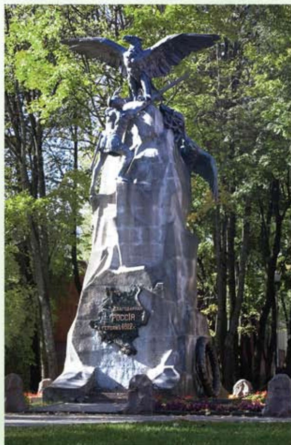
Памятник героям Отечественной войны 1812 года

Добрую славу сослужила икона и во время войны 1812 года. Покидая Смоленск, русские войска взяли этот образ с собой и он кочевал с ними на протяжении всей войны. Перед Бородинским сражением, во время молебна, по приказу фельдмаршала Михаила Кутузова икона была торжественно обнесена по всем рядам русских войск. После победы над Наполеоном она была возвращена в Смоленск и прославилась чудесами.