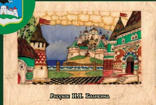
Рисунок И.Я. Билибина

Главная святыня города – Троицкий собор, с усыпальницей семьи барона А.А. Штигица, основателя Государственного Банка России, промышленника и мецената.