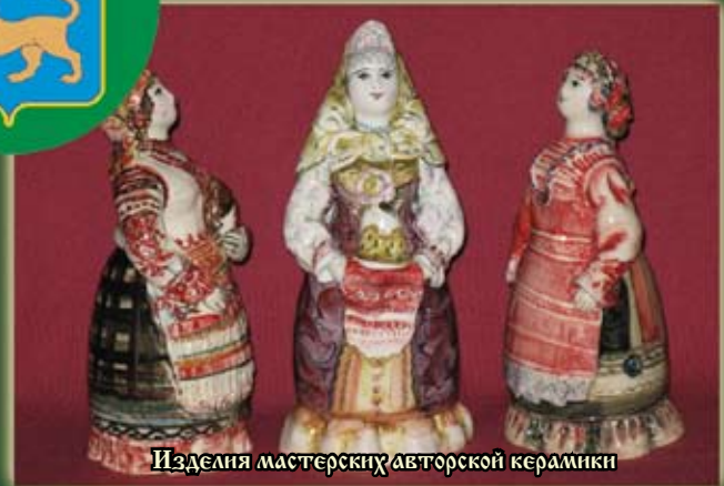
Изделия мастерских авторской керамики

Среди известных псковских ремесел широко представлены тачество, ивоплетение, кожа, металл, глина. Псковская «Мастерская авторской керамики» – это фаянс, с подглазурной росписью по мотивам древней русской архитектуры и красная глина – ружкомой, горшки, крынки, выполненные в чисто традиционном стиле старинной крестьянской посуды.