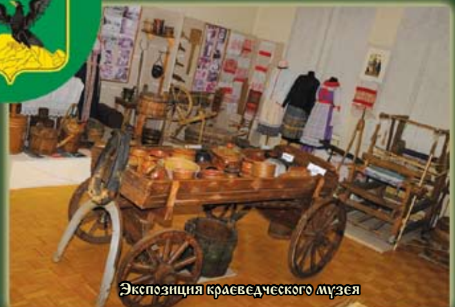
Экспозиция краеведческого музея

В настоящее время местные мастера производят изделия из дерева, кожи, глины и занимаются вышивкой – висероплетением.