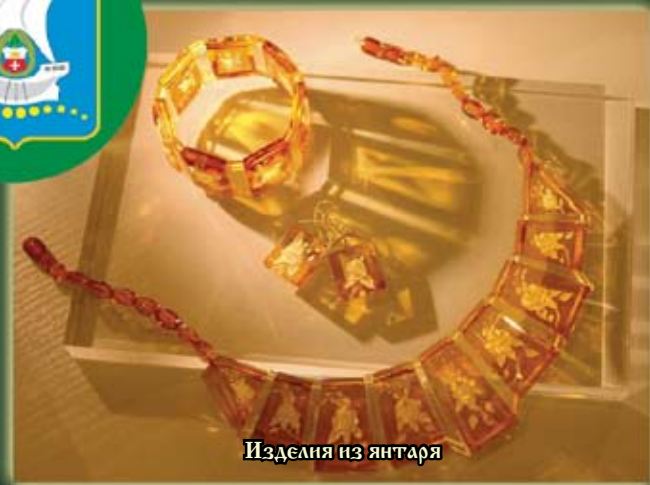
Изделия из янтаря

В городском музее янтаря хранятся уникальные природные образцы и ювелирные украшения из янтаря, изготовленные умелыми руками местных мастеров.