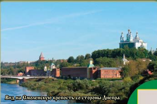
Вид на Смоленскую крепость со стороны Днепра