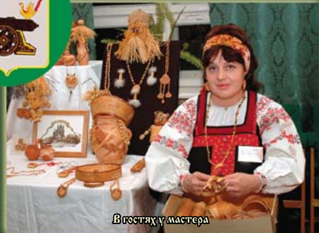
В гостях у мастера

Народные промыслы Смоленска – это береста, керамика, камень, работы по металлу, создание национальных костюмов и вышивка. Творческие коллективы города неоднократно завоевывали призовые места на всероссийских и зарубежных фестивалях и ярмарках.